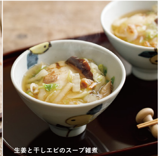
生姜と干しエビのスープ雑煮

【材料(2人分)】 ・そうめん 4束(ゆでておく) ・ごま油 大さじ1 ・A(長ネギのみじん切り 1/2本分、人参のみじんぎり 約3cm分、鶏ひき肉 150g) ・塩・鶏ガラスープの素 各適量 ・水 600ml ・B(日本酒 大さじ1、いしる(または醤油)適量、生姜de生姜 大さじ1と1/2) ・水溶き片栗粉 大さじ2 ・パクチー(または水菜) 適宜 【作り方】 ① フライパンにごま油を熱して②を炒め、塩で味を調える。 ② ①に水、鶏ガラスープの素、沸騰したらアクをとり、水溶き片栗粉でとろみをつける。 ③ そうめんを器に守り、②をかける。パクチーを添え、お好みでレモンを搾る。