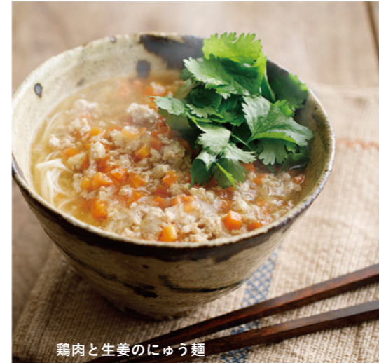
鶏肉と生姜のにゅう麺

ジンジャードリンク 三温生姜 360g 2,000円(税抜) 【商品コード】 85153 ノンシュガー ジンジャーエキス 生姜de生姜 300ml 2,000円(税抜) 【商品コード】 85157