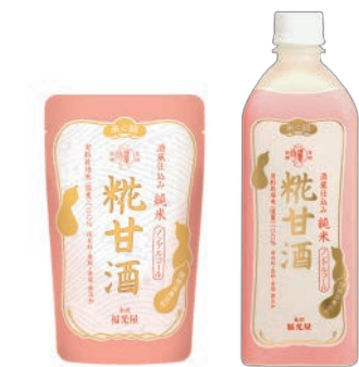
◎酒蔵仕込み 純米 糀甘酒 150g(パウチ) 230円(税込248円) 【商品コード】45214 850g(PPボトル) 800円(税込864円) 【商品コード】45280

甘酒に含まれるアミノ酸の一種、GABAには動脈硬化の予防など、多くの働きが認められています。最近では興奮鎮静効果、ストレス緩和、リラックス効果を含めた緊張緩和作用に注目が集まっています。「甘酒を飲むとホッとする」という感覚的な変化は、このGABAによる効果といえます。疲労回復や整腸作用、新陳代謝の活性による美肌効果、リラックス効果があることが、次々に解明されている甘酒。お米と麹、水の三素材からこれほど多様な成分と効果が得られることが糀甘酒が「体によい」理由です。