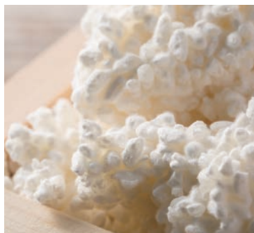
麹には多くの酵素が含まれ、お米の栄養素を分解し消化・吸収を助ける働きをもちます。

無調味、無添加、 ノンアルコール 国産米と麹、水で醱酵させた豊かな 自然の味わい。毎日の安心に。